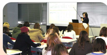
県の取り組みを熱心に学習

1・2 回生約 80 人が、イーブンへ課外授業の一環として来館されました。この研修は前年度も行われており、兵庫県の男女共同参画の現状や、男女共同参画センターの機能や役割について具体的に学べると好評を博し、「悩みの相談や学習情報等の収集場所として、友人・知人に利用を呼びかけたい」との声が上がりました。