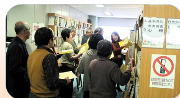
資料の豊富さに驚き！

佐用町から来られたのは、60代から80代のボランティアなどの地域活動をされている方々。男女共同参画をテーマにした講話を聞き、地域で活躍する女性たちの姿を描いたDVD「夢へのパスポート～まちづくりにかける元気な女性たち～」を鑑賞されました。参加者からは「今までは後ろに引っ込む感じだったけれど、これからは前に前にチャレンジしていきたい」といった積極的な感想が聞かれました。