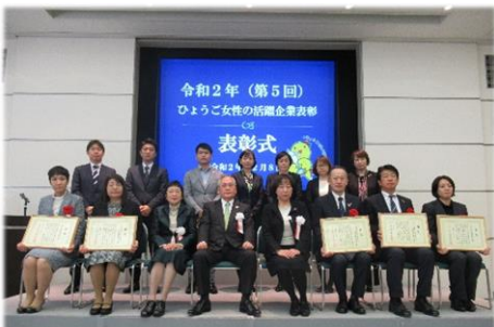
▲ひょうご女性の活躍企業表彰 表彰式の様子

オンライン配信含む114名の参加者にとって、 今後の「新しい働き方」 について深く考える機会となりました。