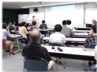
(問) 宝塚市男女共同参画センター 0797-86-4006